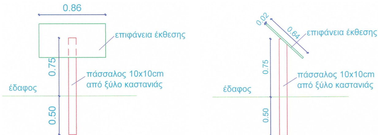
ΕΙΚΟΝΑ 3. ΟΨΗ-ΤΟΜΗ ΑΝΑΛΟΓΙΩΝ